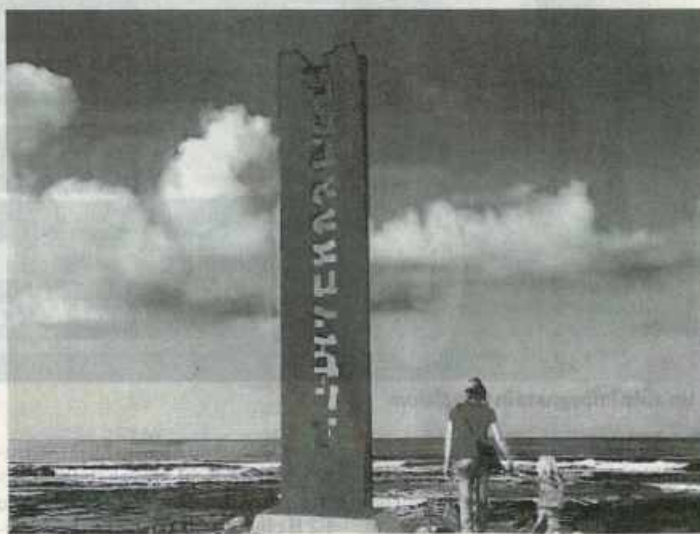
L'opera «Mare Nostrum»